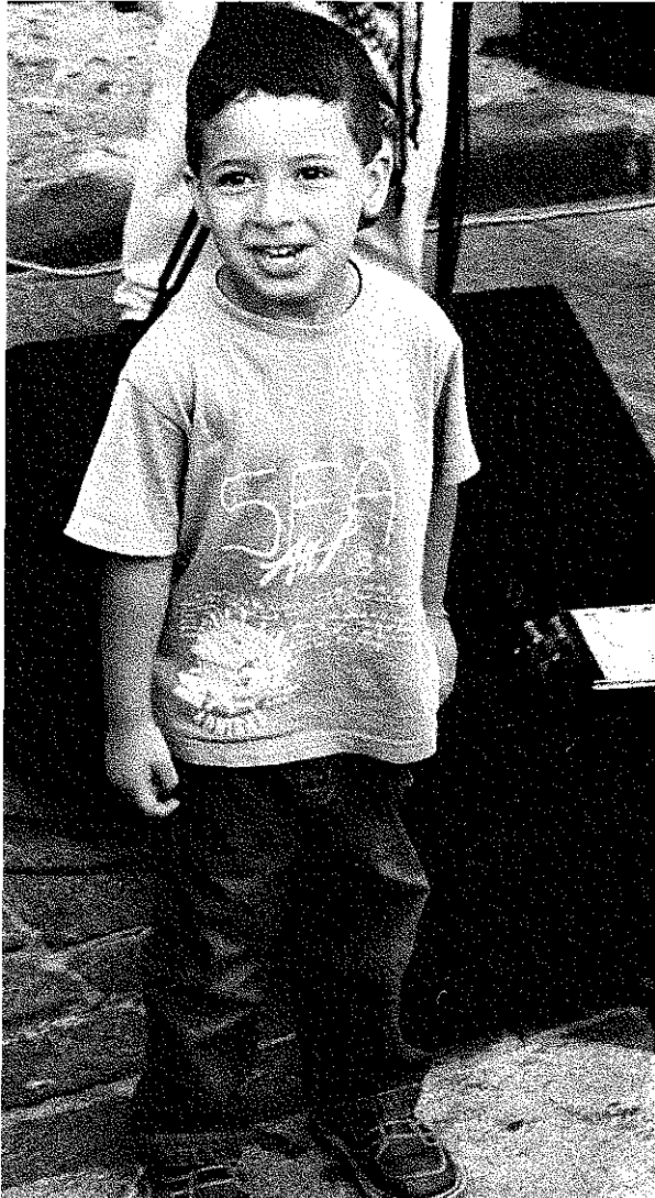
HET KIND AAN HET WOORD