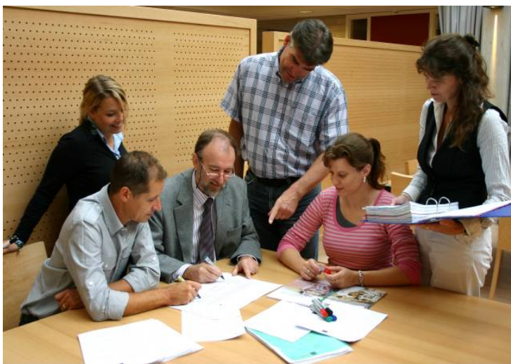
Het Kempellectoraat de kernkenniskring als leerwerkgemeenschap